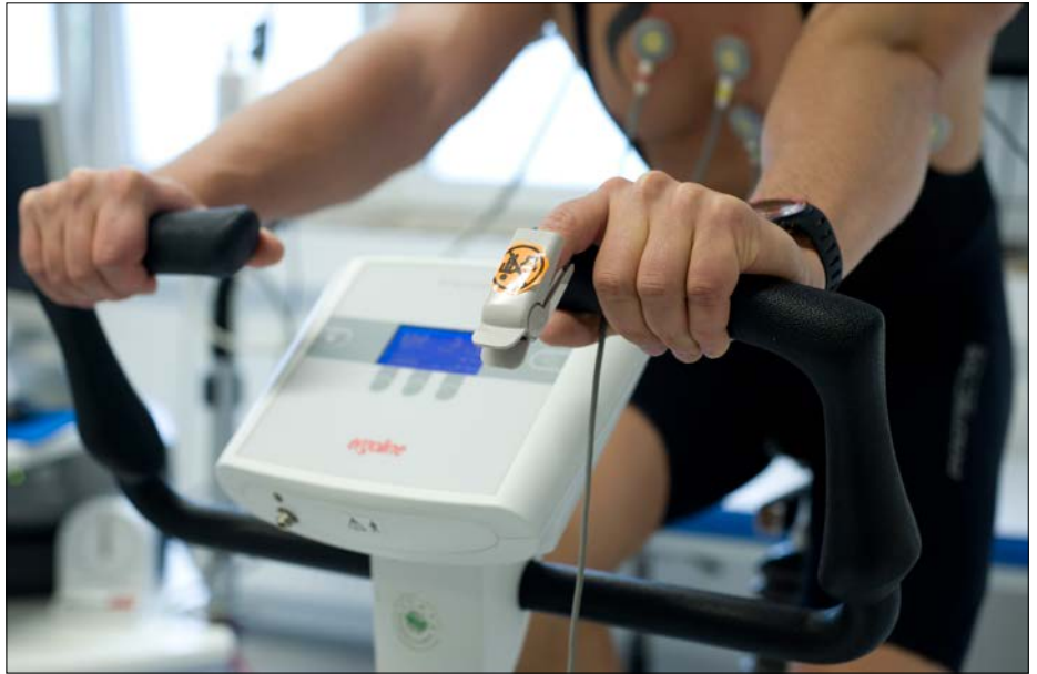
Zu Projektbeginn wurde die körperliche Leistungsfähigkeit der Probanden erhoben (Quelle: SALK)

ventionsgruppe legen den Arbeitsweg zu Fuß (in Kombination mit dem öffentlichen Verkehr) oder mit dem Fahrrad zurück, während die Kontrollgruppe weiterhin hauptsächlich das Auto zum Pendeln nutzen wird. Alle Studienteilnehmer werden durch attraktive Incentives (Jahreskarten für den öffentlichen Verkehr, Regenbekleidung, GPS-fähige Fitnessuhren und mehr) zur dauerhaften Teilnahme motiviert. Während des einjährigen Untersuchungszeitraums wird die interdisziplinäre Forschergruppe Aufzeichnungen zur Mobilität der Teilnehmer erstellen. Diese werden mit den abschließenden Untersuchungsergebnissen kombiniert. Zum Projektabschluss wird das Team damit unmittelbare Rückschlüsse auf die gesundheitlichen Effekte des Umstiegs ziehen können.